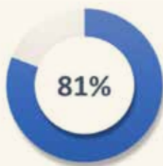
Casa da Vítima

A grande maioria das violações contra a pessoa idosa ocorre na casa da vítima (81% das ocorrências). A violação ocorre na casa do suspeito em 4% dos casos, enquanto que o registro em locais diversos (como rua, escola, entre outros) ocorre em 15% dos episódios de violação, conforme Relatório do Disque 100.