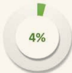
Casa do Suspeito